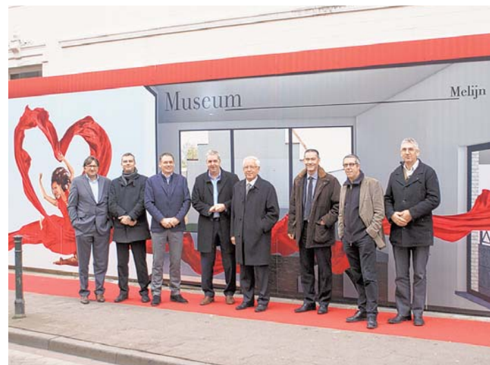
Verschillende partners zorgen ervoor dat Tervuren een nieuw woon- en winkelcentrum krijgt.